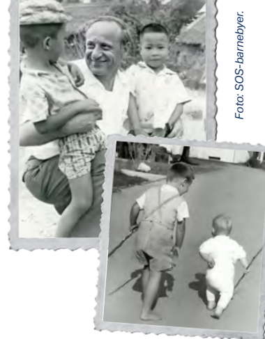
1. SOS-barnebyers grunnlegger Hermann Gmeiner besøker en barneby i Vietnam i 1968. 2. SOS-barnebyers første barneby i Imst, Østerrike.

Jeg har flere organisasjon i min «støtteportefølje» og jobber også som frivillig nå når jeg er pensjonist. Fortsatt lykke til med ALT. Dere gjør en viktig jobb! I disse tider må det innimellom føles håpløst. Jeg heier på dere.